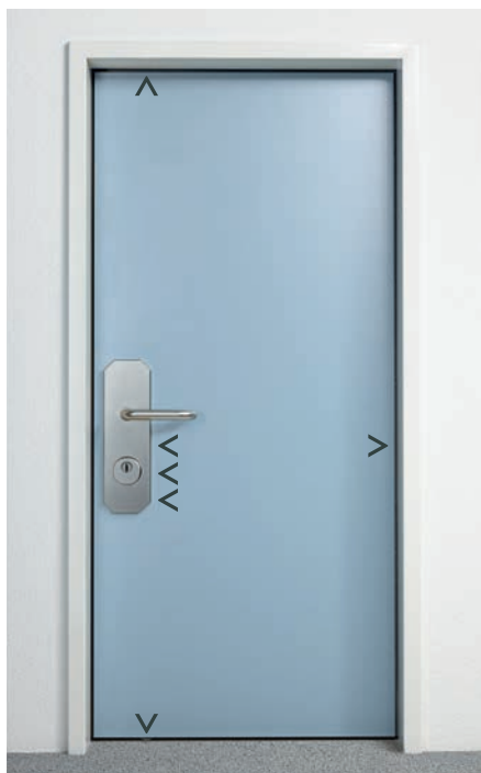
Multilock Typ 245