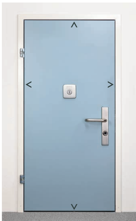
Multilock Typ 220