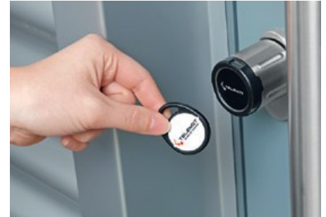
Digitaler Schliesszylinder hilock 2200

Für den Zutrittskontrollleser cryplock stehen neben der Farbe weiss zusätzlich neun Farbvarianten zur Auswahl.